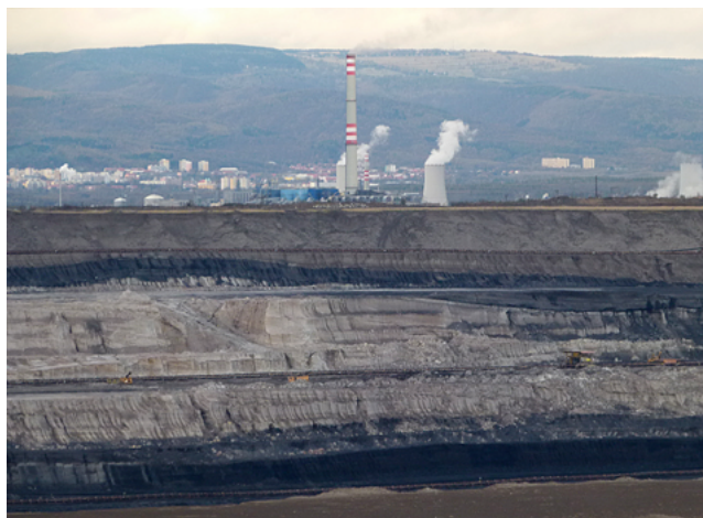
De haut en bas et de gauche à droite: Sculpture extraite de la série Cool Coal , épinés, charbon, plâtre, 60x40x20cm, 2018. Vue d'ensemble de l'exposition Cool Coal , Institut français de Prague, 2018. Photo prise de la mine à ciel ouvert de Most (CZ) , document de recherche, 2017.