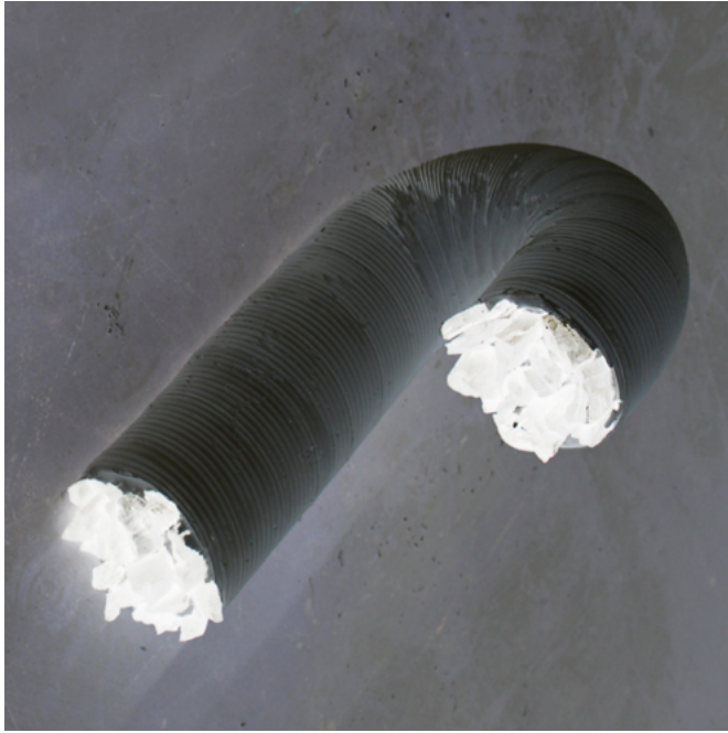
Elsa Farbos, Sculpture extraite de la série Cool/Coal , 2018