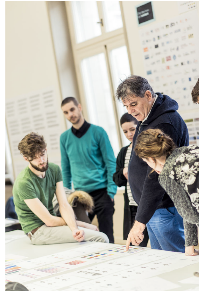
Recherche-action Identités complexes, lisibilité et intelligibilité . Initiative d'excellence / Iindex, 2016