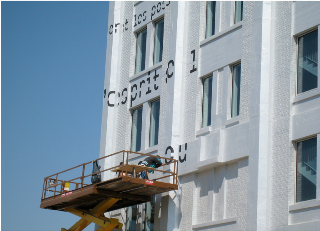
Ruedi Baur, Signalétique de la Médiathèque André Malraux , 2007-09