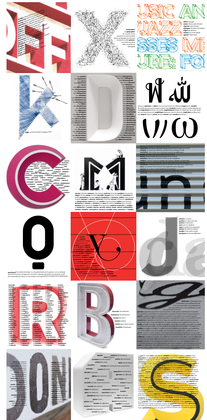
Ci-contre: Integral Ruedi Baur, ABC, 2018

Le dessein du dépassement de cette société crispée autour d'un esprit de concurrence passe véritablement par la prise de conscience de nos interdépendances et du potentiel du «design de nos relations à l'autre». Cette notion se trouve utilisée ici pour exprimer ces perspectives qui restent encore à explorées.