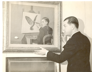
René Magritte. La clairvoyance . 1936.

Sur rendez-vous, délai de réservation 8 jours minimum.