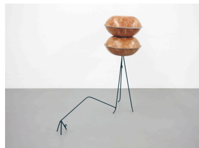
Koenraad Dedobbeleer, Strategy of physical separation and visual connection , 2010

Dans ce cadre, deux animateurs sont à la disposition des enseignants et de leurs classes afin de découvrir et de mieux appréhender les nouveaux moyens d'expression qui constituent l'art actuel. Dans cette attente, nous vous prions d'agréer nos salutations les meilleures.